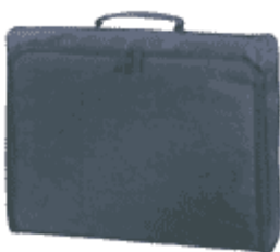
Teczka na dokumenty

Miękka teczka konferencyjna bez kieszeni i podziałów wewnętrznych.