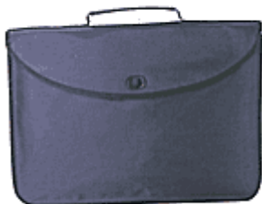
Teczka na dokumenty

Częściowo usztywniona teczka konferencyjna.