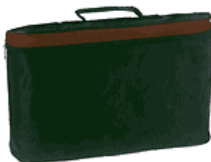
Teczka na dokumenty

Miękka teczka konferencyjna bez kieszeni i podziałów wewnętrznych.