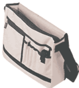
Teczka na dokumenty

Częściowo usztywniona teczka konferencyjna, kieszka na telefon komórkowy, szłówki na długopisy, kieszka zamykana na suwak, pasek na ramię.